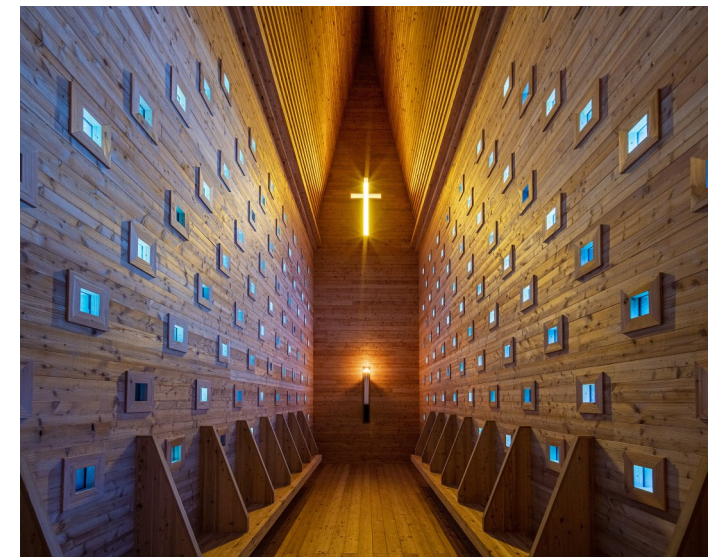
Innenansicht der Kapelle Oberthürheim